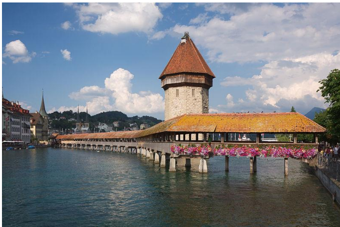
Die Kapellbrücke in Luzern

Für die Schweiz sind typisch die Uhren, Medikamente und Lebensmittel (Käse, Schokolade, Pralinen,...).