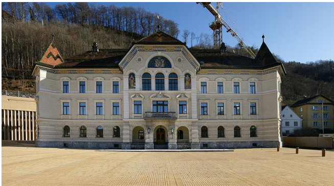
Landtag in Vaduz

Die Hauptstadt des Fürstentums Liechtenstein ist Vaduz. Hier gibt es viele Banken und Geschäfte. Eine Gemäldegalerie. Hoch über der Stadt liegt das Schloss Vaduz. Hier residiert die fürstliche Familie.