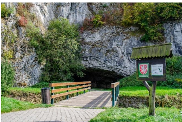
Obrázek 3 Vchod do Sloupsko-šošůvských jeskyní

Sloupsko-šošůvské jeskyně jsou složitým komplexem chodeb a hlubokých propastí ve dvou výškových úrovních. Návštěvníkům se otevírají fascinující pohledy do nitra mohutných propastí i na okouzlující krápníkovou výzdobu. Součástí prohlídky je také světově proslulá archeologická lokalita jeskyně Kůlna – pravěké sídliště a naleziště pozůstatků neandrtálského člověka asi 120 000 let staré. Ve Sloupsko-šošůvských jeskyních je nejznámější Eliščina jeskyně. Je v ní výborná akustika, a proto se příležitostně využívá pro koncerty komorní hudby.