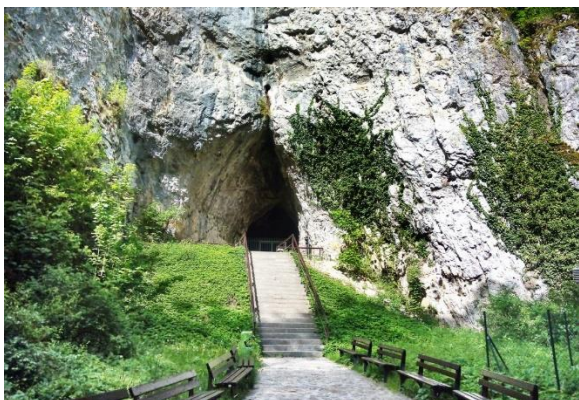
Obrázek 2 Vchod do Kateřinské jeskyně

Kateřinská jeskyně je opředená pověstí o malé pasačce Kateřince, která zahynula, když hledala svou zatoulanou ovečku. Po procházce monumentálním Hlavním dómem, největší zpřístupněnou podzemní prostorou v republice s rozměry 96x44x20 metrů, si návštěvníci prohlédnou novou jeskyni s unikátním krápníkovým seskupením Bambusovým lesíkem a efektně osvětleným útvarem Čarodejnice.