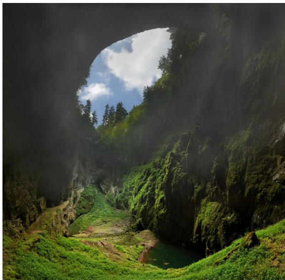
Obrázek 5 spodní část propasti Macocha

Roku 1909 byly objeveny Punkevní jeskyně a roku 1914 bylo propojeno dno Macochy se suchou cestou z Pustého žlebu. Cestu ponornou říčkou Punkvou se podařilo zdolat a zpřístupnit roku 1933.