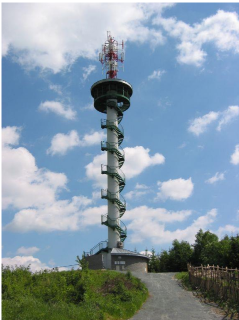
Obrázek 17 rozhledna Podvrší u Veselice

Z ochozu je návštěvník rozhledny odměněn pohledem na celé území CHKO Moravský kras, od Helišovy skály, Hády a ze vzdálenějších míst mimo jiné např. na chladicí věže elektrárny Dukovany ve vzdálenosti cca 52 km, dále můžeme vidět Pálavské vrchy u Mikulova, nejvyšší vrchol Dražanské vrchoviny, kopec Skalky u Benešova s meteorologickým radarem, pohoří Českomoravské vysočiny...atd. Také nemůžeme zapomenout zmínit, že z Podvrší jsou viditelné i tři další rozhledny, a to Babí lom u Lelekovic, Milenka u Rudky a rozhledna u obce Kozárov.