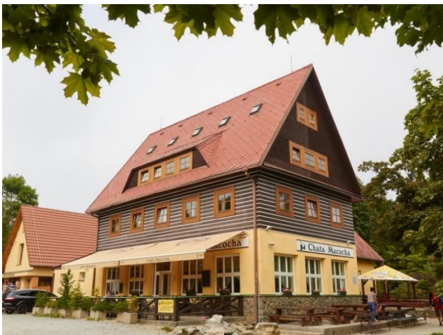
Obrázek 6 chata Macocha

Vzhledem k tomu, že se dříve Moravskému krasu říkalo „Moravské Švýcarsko“, jednalo se o styl švýcarské chaty. Chata Macocha byla v roce 1996 zrekonstruována a modernizována.