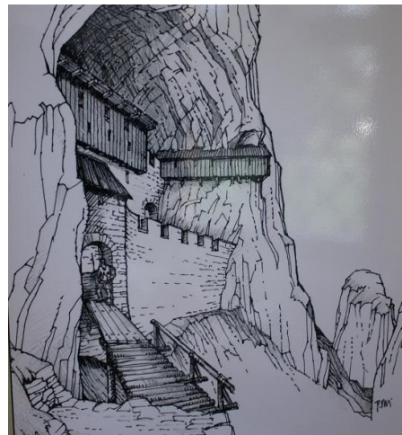
Obrázek 10 hrad v Rytířské jeskyni