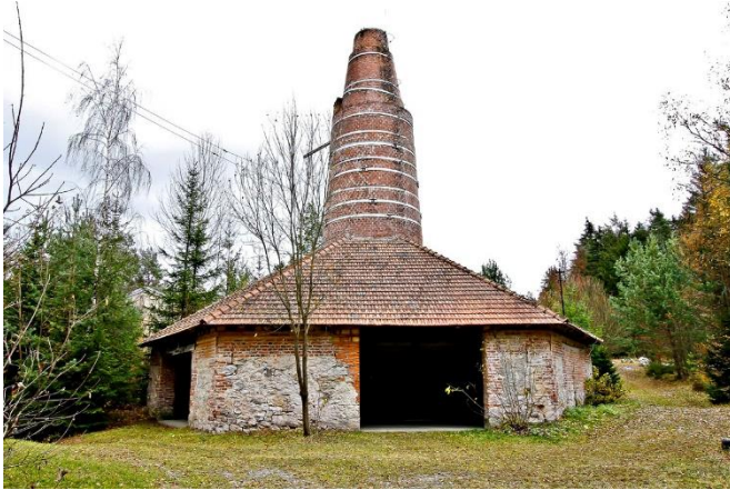
Obrázek 15 Vápenka Velká Dohoda