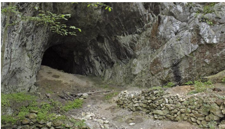
Obrázek 9 přední část Rytířské jeskyně