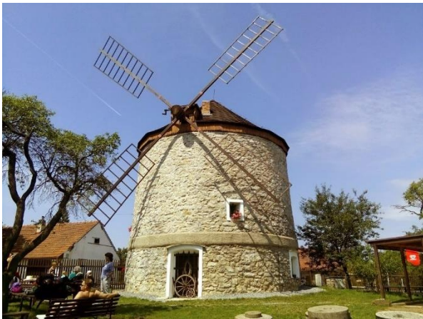
Obrázek 12 větrný mlýn v obci Rudice