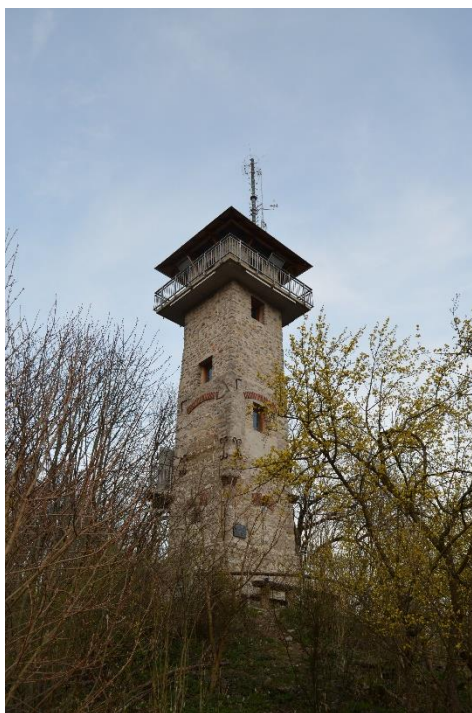
Obrázek 16 Alexandrova rozhledna

Přestože se rozhledna nachází v katastru obce Babice nad Svitavou, je majetkem města Adamova, které spolufinancovalo její renovaci v roce 2009. Roku 2014 bylo na Alexandrovu rozhlednu nainstalováno noční nasvětlení, které je, vzhledem k omezením daným správou CHKO, možné provozovat jen mimo platnost letního času.