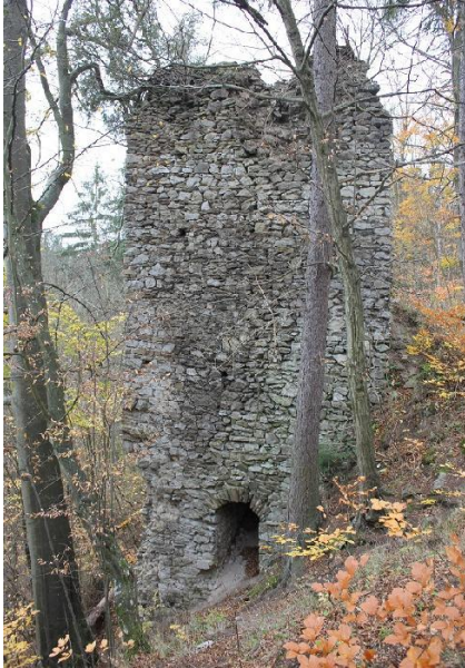
Obrázek 7 zřícenina hradu Holštejn