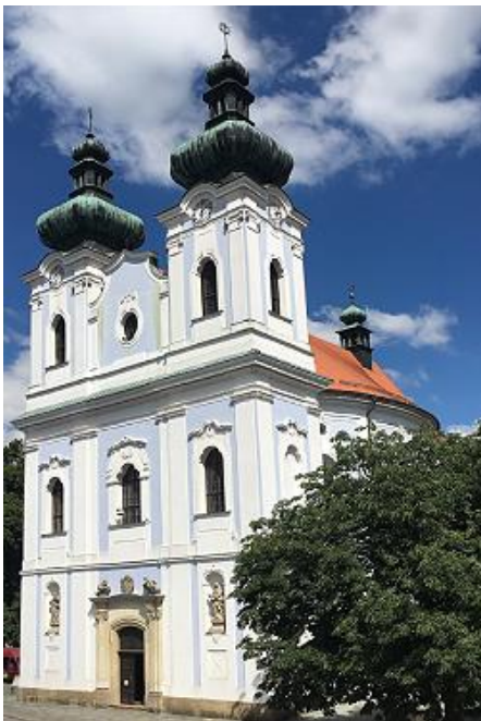
Obrázek 14 kostel Pany Marie Bolestné ve Sloupě

Kostel Panny Marie Bolestné je římskokatolický farní kostel a mariánské poutní místo ve Sloupě v Moravském krasu. Kostel byl vystavěn v letech 1751–1754 na základě zázračného uzdravení dcery místního mlynáře a z podnětu rájeckých hrabat z rodu Rogendorfů. Autorem architektonického návrhu je italský stavitel Isidor Marcello Canavale, na stavbu dohlížel boskovický stavitel Vavřinec Pavel Mertha. Půdorys kostela je ve tvaru želvy, což je mariánským symbolem ochrany. V dubnu 2016 byl vyhlášen nejlépe opravenou jihomoravskou památkou v kategorii velkých staveb. Hlavním poutním dnem je zde pátek před Květnou nedělí, hovorově nazýván „Květný pátek“.