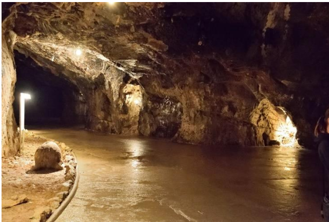
Obrázek 4 jeskyně Výpustek