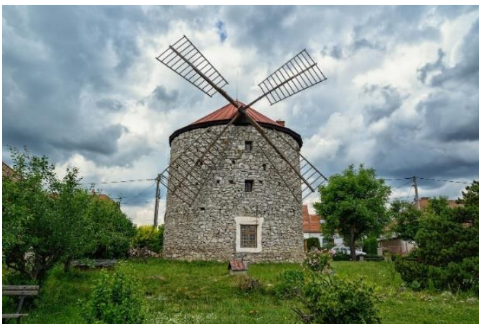
Obrázek 11 větrný mlýn v Ostrově u Macochy