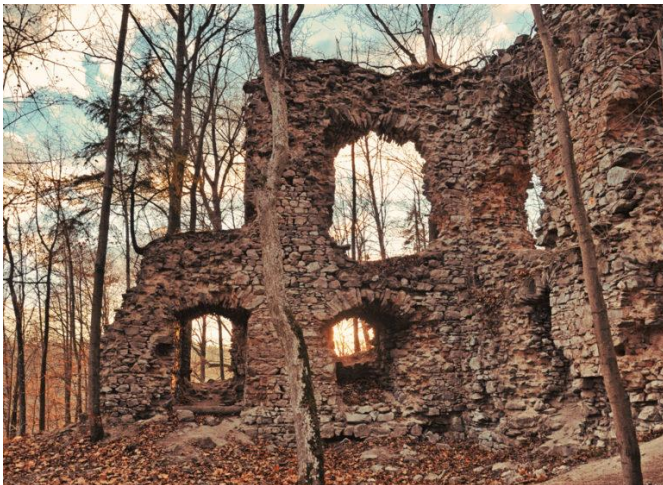
Obrázek 8 zřícenina hradu Blansek