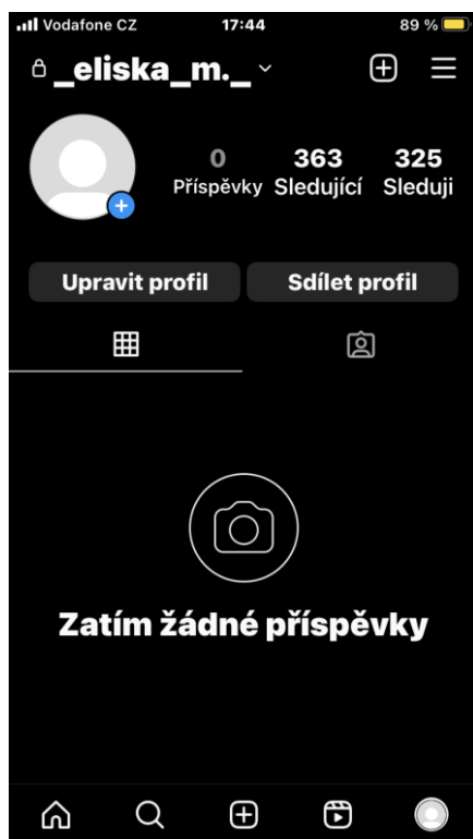
Obrázek 1- Profil na Instagramu

Na vašem vytvořeném profilu si můžete nastavit svoji vlastní profilovou fotku, vlastní bio a zda váš účet bude soukromý nebo veřejný. Pak už je vše na vás. Můžete přidávat fotky nebo videa (příspěvky), stories (fotka nebo video, které zveřejníte na 24 hodin).