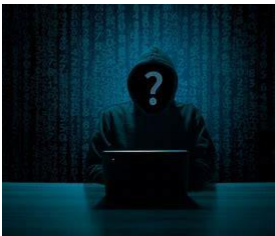
Obrázek 8- Kyberstalking

Jde o formu pronásledování na sociálních sítích. Většinou je pronásledovatel známý toho, koho pronásleduje. Oběti někdy hrozí ztráta soukromí a pocitu bezpečí. Pronásledovatel se se svojí obětí pokouší kontaktovat prostřednictvím SMS nebo přes sociální sítě. Pronásledovatel může mít mnoho motivů, například chce svoji oběť obtěžovat, vyhrožovat a vydírat v opačném případě chce opětovně navázat vztahu. Nejlépe se budete bránit používáním silného hesla a dodržováním pravidel bezpečného užívání internetu.