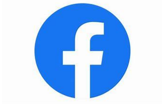
Obrázek 3- Logo Facebooku

Domnívám se, že je spíše pro starší generaci. Lidé si přidávají posty na své účty a sdílí věci svým kamarádům. Jediné co zde nejde je psaní zpráv, proto k sociální síti patří messenger a WhatsApp. Obě tyto aplikace slouží ke psaní textových zpráv. To co se mi na Facebooku opravdu líbí je to, když vám přijde oznámení o tom, že někdo z vašich přátel na Facebooku má narozeniny.