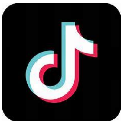
Obrázek 5- Logo tik toku

Stejně jako YouTube je tato aplikace pro sdílení videí. Rozdíl je ale veliký. Video na tik toku jsou krátká, nejdelší video může mít maximálně tři minuty. Tahle aplikace vznikla v Číně v roce 2016. Aplikace na podobný styl v té době existovala. Jmenovala se Musica.ly. Tik tok ale aplikaci odkoupil. Tahle aplikace fungovala na stejný princip jako tik tok. V dnešní době má aplikace více než 689 mil. aktivních uživatelů. Je dostupná ve 155 zemích z celého světa a je přeložena do 75 jazyků. Je opravdu velmi snadné stát se slavným. Stačí dělat to co je právě v trendech a tik tok vás sám začne doporučovat. Také je velmi lehké si na téhle sociální síti vybudovat závislost, protože tik tok upozoruje to čemu dáváte like a to co shlédnete víckrát. Pak vám to jen bude nabízet ve vaší "for you page(fyp)". Vaše hlavní stránka je rozdělena na dvě stránky. První, ta která se vám otevře když rozjedete aplikaci je for you page, kde vám vyskakují náhodná videa a ta druhá je stránka lidí, které vy sledujete. Ukazuje vám jejich tvorbu na téhle platformě.