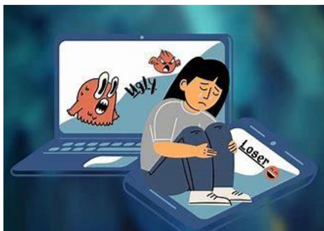
Obrázek 7- kyberšikana

Vždy se zde nachází oběť, agresor a přihlížejíci. Agresor většinou bývá anonymní, tím pádem se méně bojí přistižení a trestu. Někdy je útok jen jednorázový, oběť se k němu ale neustále může vracet a může si způsobit dlouhodobé trauma. Přihlížejíci jsou lidé, kteří o tom všem vědí a můžou se kdykoliv připojit do šikany. Nejlépe se kyberšikany vyvarujete dodržováním několika pravidel, které nejčastěji upozorňují na rozesílání osobních údajů.