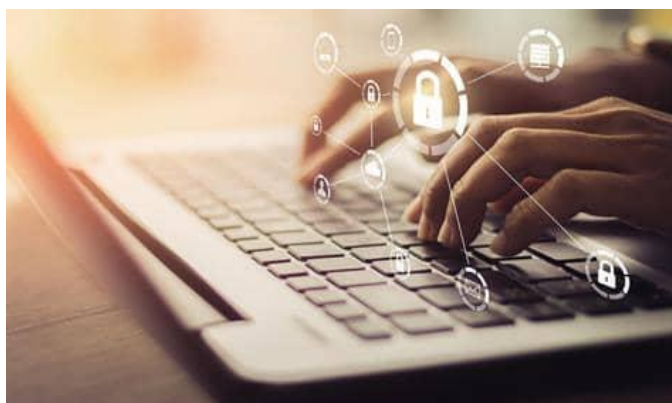
Obrázek 6- Nebezpečí na internetu

Sice zde každý sleduje to, co ho doopravdy baví a zajímá, ale i přes to se zde vyskytují lidé, kteří rádi ubližují ostatním. Přes sociální sítě to jde jediným způsobem, a to kyberšikanou a kyberstalkingem. Někteří lidé si takové lidi zablokují, jsou však i lidé, kteří si neví rady, jak tohle mají řešit. Někomu to způsobí psychické problémy, krajní varianta může být i tím že si začnou z tohoto důvodu ubližovat. Takové problémy by se měly řešit s dospělou osobou nejlépe s rodiči nebo s někým, kdo je vám blízký. Ve škole je možné oslovit metodika prevence či školního psychologa. Nebo je zde možnost kontaktovat odborníka na lince bezpečí. V krajním případě můžete kontaktovat i policii.