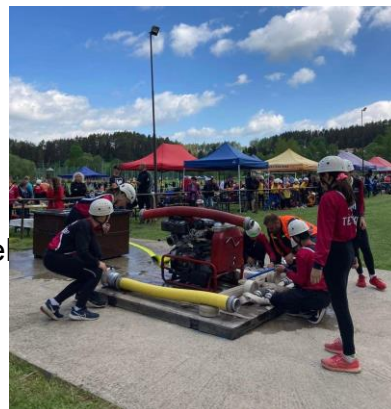
Obr. 6 SDH Těchov - požární útok, okresní kolo 2022

Každý závodník musí být správně ustrojen.