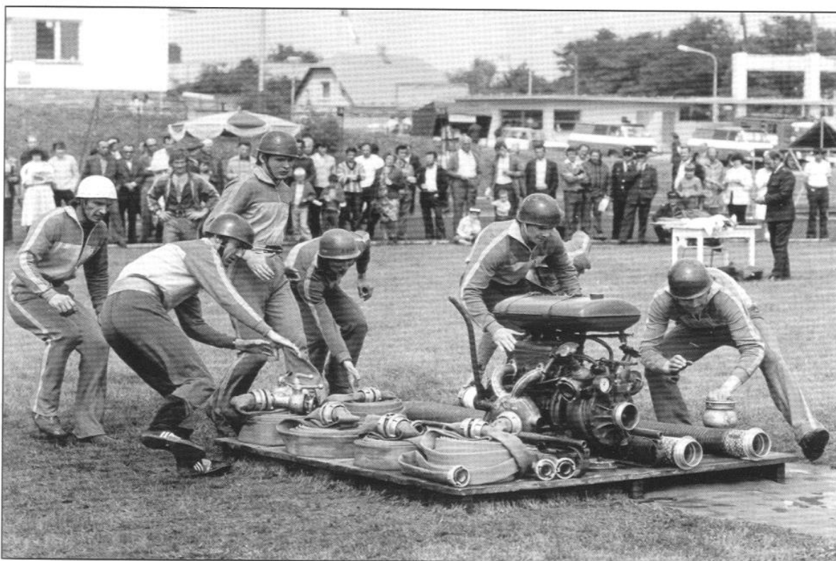
Požární útok družstva Jihočeského kraje