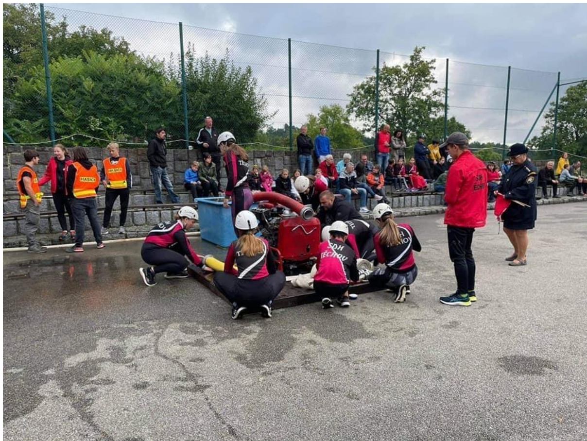
Obr. 1 SDH Těchov - na závodě O pohár starosty SDH Těchov

Pátým rokem běhám za SDH Těchov, ale předtím jsem tři roky běhala za SDH Němčice.