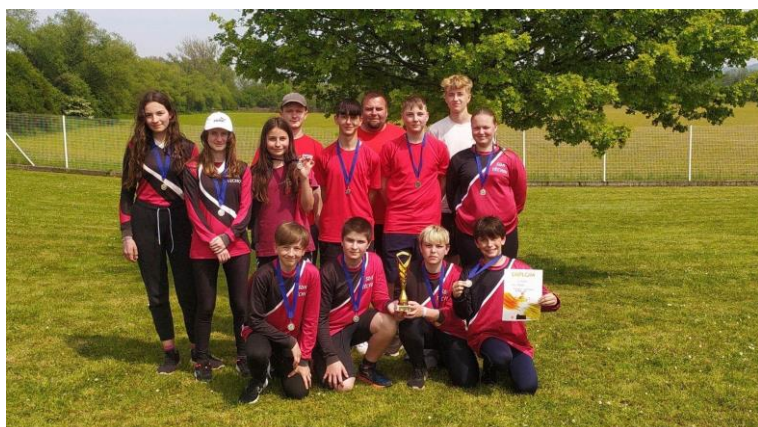
Obr. 4 SDH Těchov - okresní kolo Velké Opatovice 2023 - druhé místo