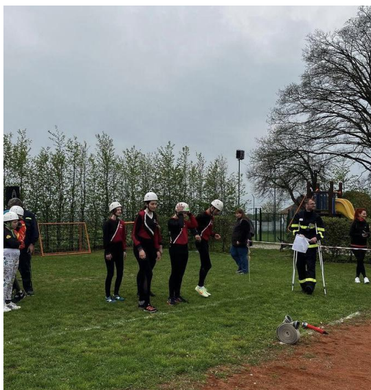
Obr.8 SDH Těchov - štafeta požárních dvojic ve Vavřinci

První závodník (velitel) pouze oběhne metu, po doběhnutí za startovní čáru vybíhá první dvojice, jeden z této dvojice jeden sebere hadici a druhý proudnici. Společně běží k hydrantu, kde jeden rozhodí hadici koncovku zapojí do hydrantu, druhou dává druhému závodníkovi. Ten do koncovky zapojí proudnici a pokládá na danou čáru. Obíhají metu a běží zpět, jakmile proběhnou startovní čáru vybíhá druhá dvojice, Ta prvně obíhá metu a jeden závodník bere zapojenou proudnici i s hadicí a překládá ji k hydrantu, následně tam odpojí hadici z hydrantu a proudnici z hadice. Běží zpět ke startovní čáře. Druhý závodník, poté co mu ji první přehne, začne motat, až ji domotá běží na startovní čáru, tentokrát se jedná i o cílovou čáru. V tuto dobu se časomíra stopuje.