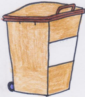
die braune Tonne

Weißglas Buntglas Plastik Problemstoffe Altpapier Restmüll Biomüll Metall