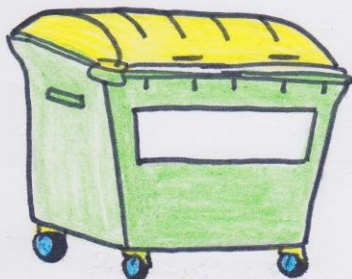
die gelbe Tonne