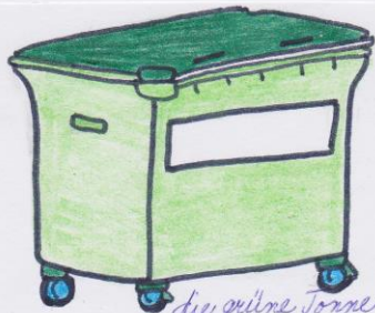
die grüne Tonne