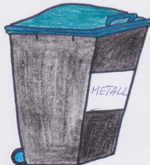
die blaue Tonne