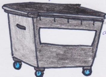
die schwarze Tonne

„Wohin kommt die Zeitung?“ „Zeitung kommt in die rote Tonne!“